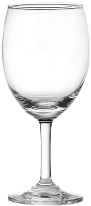
Red wine glass / Rotweinglas / Verre à vin rouge / Copa de vino tinto / Calice di vino rosso

It Una serie di calici semplici, robusti e pratici, per portare un'atmosfera esclusiva sulle tavole di tutti i giorni. Bordo rinforzato e stabilità dei bicchieri ottimizzata, per una serie che resiste alla prova del tempo e del servizio intensivo.