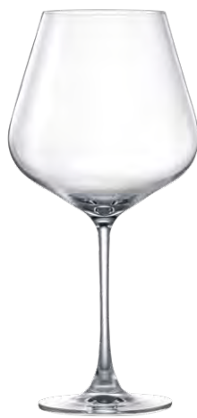
Burgundy glass / Burgunderglas / Verre à Bourgogne / Copa de Bourgogne / Calice da Bourgogne