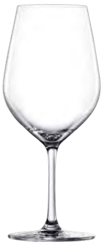
Bordeaux glass / Bordeauxglas / Verre à Bordeaux / Copa de Bordeaux / Calice da Bordeaux

It La città di Tokyo reinventa costantemente il concetto di modernità coniugando sapientemente l'amore per il futuro con il rispetto per i valori del passato. Questa metropoli mozzafiato ispira la linea Tokyo Temptation, versione contemporanea di un design classico, creata per una cucina moderna di alto livello in cui spiccano ricercatezza e formalità.