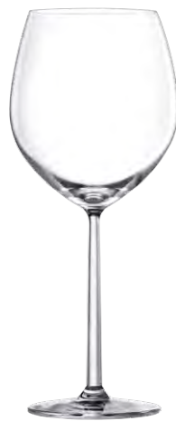
Burgundy glass / Burgunderglas / Verre à Bourgogne / Copa de Bourgogne / Calice da Bourgogne LS03BG23 Ø 10.4 cm/Ht. 24.9cm/Cont. 66.5cl 6