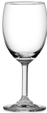
White wine glass / Weißweinglas / Verre à vin blanc / Copa de vino blanco / Calice di vino bianco