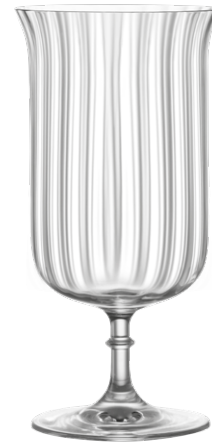
Cocktail glass / Cocktailglas / Verre à cocktail / Copa de cóctel / Calice da cocktail