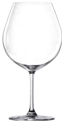
Burgundy glass / Burgunderglas / Verre à Bourgogne / Copa de Bourgogne / Calice da Bourgogne