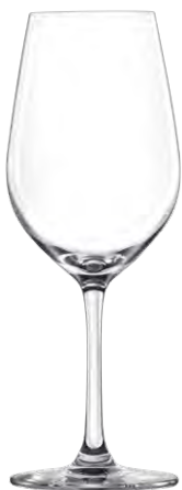
Chardonnay glass / Chardonnayglas / Verre à Chardonnay / Copa de Chardonnay / Calice da Chardonnay