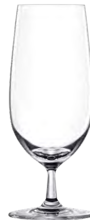
Beer glass / Bierglas / Verre à bière / Copa de cerveza / Bicchiere da birra LS03BR14 Ø 7.6cm/Ht. 18.2cm/Cont. 39.5cl 6