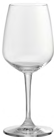
Water goblet / Wasserglas / Verre à eau / Copa de agua / Calice da acqua