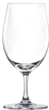
Water goblet / Wasserglas / Verre à eau / Copa de agua / Calice da acqua