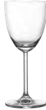
Cocktail glass / Cocktailglas / Verre à cocktail / Copa de cóctel / Calice da cocktail