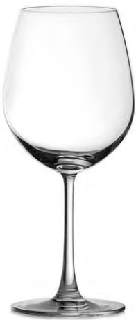
Bordeaux glass / Bordeauxglas / Verre à Bordeaux / Copa de Bordeaux / Calice da Bordeaux

It Il design classico ed elegante della linea Madison presenta un bordo sottile che migliora notevolmente l'esperienza gustativa. La coppa sovradimensionata aumenta la superficie di contatto del vino con l'aria, permettendogli di esprimere tutti i suoi aromi durante la rotazione del calice. I bicchieri da vino più grandi riescono anche a rendere ancora più piacevole la degustazione.