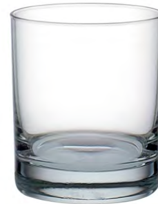
Double rocks tumbler / Double Rocks-Becher / Gobelet double rocks / Vaso double rocks / Bicchiere double rocks