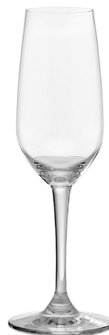
Champagne flute / Champagnerflöte / Flûte à Champagne / Copa de Champagne / Calice da Champagne