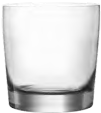
Lowball tumbler / Lowball Becher / Gobelet Lowball / Vaso Lowball / Bicchiere Lowball

La linea Rims è semplice a prima vista e complessa a uno sguardo più attento. Capace di esprimere tutto il suo potenziale solo una volta riempita e pronta per essere servita, questa linea di pregiati bicchieri da bar in cristallo lascia libero spazio alla creatività, senza interferenze, mettendo al centro della scena il locale e il concetto che esso rappresenta.