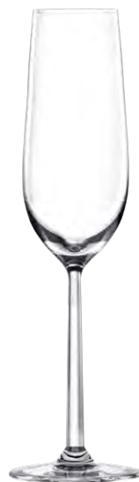
Champagne flute / Champagnerflöte / Flûte à Champagne / Copa de Champagne / Calice da Champagne LS03CP09 Ø 5.9cm/Ht. 26.6cm/Cont. 25cl 6