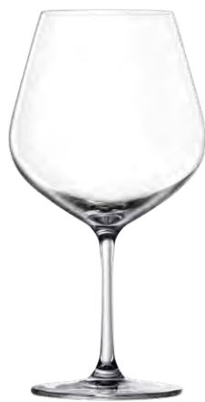
Burgundy glass / Burgunderglas / Verre à Bourgogne / Copa de Bourgogne / Calice da Bourgogne