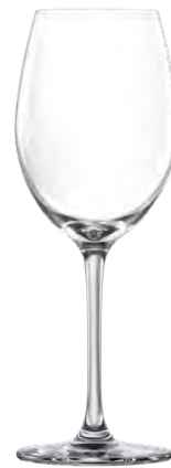
Chardonnay glass / Chardonnayglas / Verre à Chardonnay / Copa de Chardonnay / Calice da Chardonnay