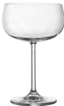
Cocktail coupe / Cocktailschale / Coupe à cocktail / Copa de cóctel / Calice da cocktail