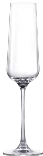
Champagne flute / Champagnerflöte / Flûte à Champagne / Copa de Champagne / Calice da Champagne