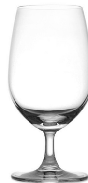
Water goblet / Wasserglas / Verre à eau / Copa de agua / Calice da acqua