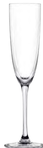
Champagne flute / Champagnerflöte / Flûte à Champagne / Copa de Champagne / Calice da Champagne