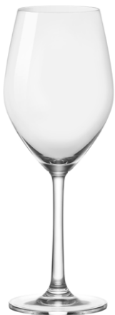
White wine glass / Weißweinglas / Verre à vin blanc / Copa de vino blanco / Calice di vino bianco