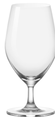
Water goblet / Wasserglas / Verre à eau / Copa de agua / Calice da acqua