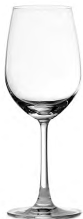
White wine glass / Weißweinglas / Verre à vin blanc / Copa de vino blanco / Calice di vino bianco