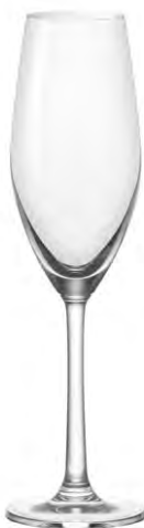
Champagne flute / Champagnerflöte / Flûte à Champagne / Copa de Champagne / Calice da Champagne