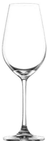
CRISP White wine glass / Weißweinglas / Verre à vin blanc / Copa de vino blanco / Calice da vino bianco

LS10CW13 Ø 7.7cm/Ht. 23.5cm/Cont. 36.5cl