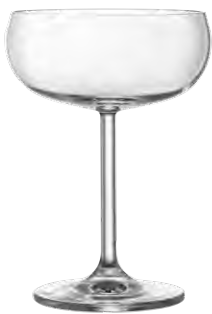
Cocktail coupe / Cocktailschale / Coupe à cocktail / Copa de cóctel / Calice da cocktail