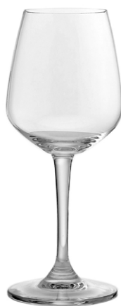
White wine glass / Weißweinglas / Verre à vin blanc / Copa de vino blanco / Calice di vino bianco