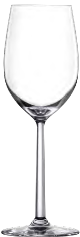
Chardonnay glass / Chardonnayglas / Verre à Chardonnay / Copa de Chardonnay / Calice da Chardonnay LS03CD14 Ø 8.2cm/Ht. 24.5cm/Cont. 40.5cl 6