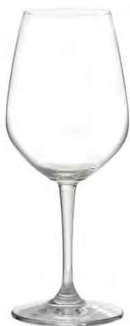
Red wine glass / Rotweinglas / Verre à vin rouge / Copa de vino tinto / Calice di vino rosso

It La serie contemporanea per eccellenza dai contorni spigolosi, dalle capienze e dalle proporzioni particolarmente generose. I bicchieri sono robusti e solidi, ma non scendono a compromessi con l'estetica e i piaceri della degustazione, grazie soprattutto ai bordi particolarmente sottili.