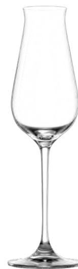
SPARKLING Sparkling wine glass / Schaumweinglas / Flûte à vin pétillant / Flauta de vino espumoso / Flute da spumante