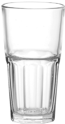
Long drink tumbler / Longdrinkbecher / Gobelet à long drink / Vaso de trago largo / Bicchiere da long drink

It Questa serie sfaccettata è ideale per i baristi che si diletano a creare bevande rinfrescanti accompagnate da cubetti di ghiaccio, frutta o altri ingredienti decorativi. La sua estetica senza tempo garantisce l'originalità delle preparazioni. Studiata per essere impilabile, la serie Centra è pratica e facile da sistemare.