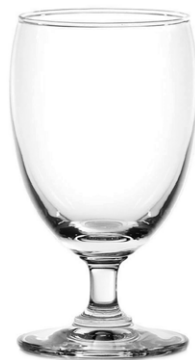
Water goblet / Wasserglas / Verre à eau / Copa de agua / Calice da acqua