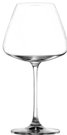
ELEGANT Red wine glass / Rotweinglas / Verre à vin rouge / Copa de vino tinto / Calice da vino rosso