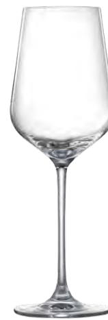
Cabernet glass / Cabernetglas / Verre à Cabernet / Copa de Cabernet / Calice da Cabernet