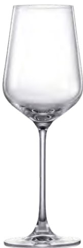
Chardonnay glass / Chardonnayglas / Verre à Chardonnay / Copa de Chardonnay / Calice da Chardonnay