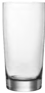
Highball tumbler / Highball Becher / Gobelet Highball / Vaso Highball / Bicchiere Highball