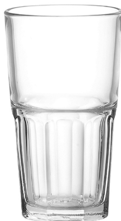
Highball tumbler / Highball Becher / Gobelet Highball / Vaso Highball / Bicchiere Highball