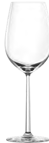
Beaujolais glass / Beaujolaisglas / Verre à Beaujolais / Copa de Beaujolais / Calice da Beaujolais LS03BJ18 Ø 8.8cm/Ht. 25.8cm/Cont. 51.5cl 6