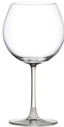
Burgundy glass / Burgunderglas / Verre à Bourgogne / Copa de Bourgogne / Calice da Bourgogne