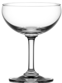
Champagne coupe / Champagnerschale / Coupe à Champagne / Copa de champagne / Calice da Champagne