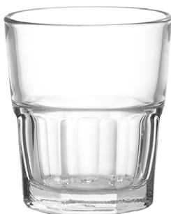
Rocks tumbler / Rocks-Becher / Gobelet rocks / Vaso rocks / Bicchiere rocks