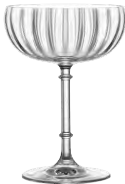
Cocktail coupe / Cocktailschale / Coupe à cocktail / Copa de cóctel / Calice da cocktail