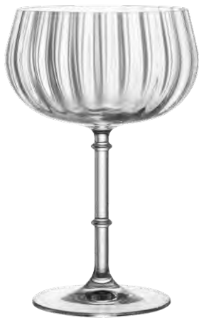
Cocktail coupe / Cocktailschale / Coupe à cocktail / Copa de cóctel / Calice da cocktail

It La linea Rims Orient rievoca la lussureggiante foresta pluviale dell'Asia sudorientale, con il suo inarrestabile monsone umido, e richiama l'immagine di argini traboccanti. Rims Orient è stata creata per soddisfare le reali esigenze dei bar di alto livello e sviluppata da Lucaris in collaborazione con Thomas Anostam, il noto consulente creativo per l'ospitalità in Asia.