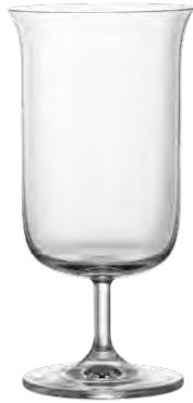
Cocktail glass / Cocktailglas / Verre à cocktail / Copa de cóctel / Calice da cocktail