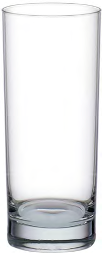
Long drink tumbler / Longdrink-becher / Gobelet à long drink / Vaso de trago largo / Bicchiere da long drink

Lo spessore del fondo assicura una migliore stabilità: è il bicchiere multiuso perfetto per birrerie, bar, hotel e ristoranti. Il volume si adatta ai bisogni dei professionisti per la preparazione di cocktail o per servire succhi di frutta e soda.