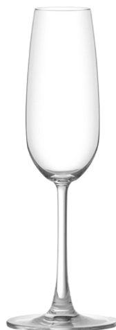
Champagne flute / Champagnerflöte / Flûte à Champagne / Copa de Champagne / Calice da Champagne