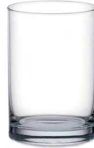
Juice tumbler / Saftbecher / Gobelet à jus / Vaso de jugo / Bicchiere da succo