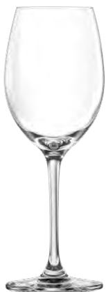
Riesling glass / Rieslinglas / Verre à Riesling / Copa de Riesling / Calice da Riesling