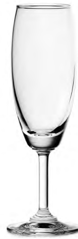
Champagne flute / Champagnerflöte / Flûte à Champagne / Copa de Champagne / Calice da Champagne