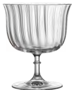
Cocktail coupe / Cocktailschale / Coupe à cocktail / Copa de cóctel / Calice da cocktail