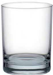
Rocks tumbler / Rocks-Becher / Gobelet rocks / Vaso rocks / Bicchiere rocks