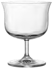
Cocktail coupe / Cocktailschale / Coupe à cocktail / Copa de cóctel / Calice da cocktail