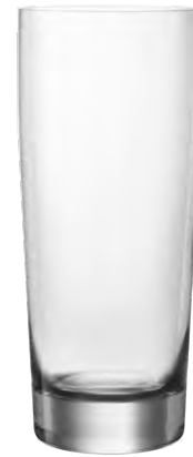
Quencher tumbler / Quencher- becher / Gobelet Quencher / Vaso Quencher / Bicchiere Quencher