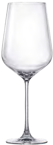
Bordeaux glass / Bordeauxglas / Verre à Bordeaux / Copa de Bordeaux / Calice da Bordeaux

It La linea Hong Kong Hip trae ispirazione dalla vitalità che caratterizza l'omonima metropoli asiatica. La sua silhouette moderna e all'avanguardia è perfetta per le occasioni in cui i vini più pregiati e le personalità più alla moda si incontrano per creare un'atmosfera assolutamente di tendenza.