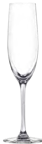
Champagne flute / Champagnerflöte / Flûte à Champagne / Copa de Cham- pagne / Calice da Champagne