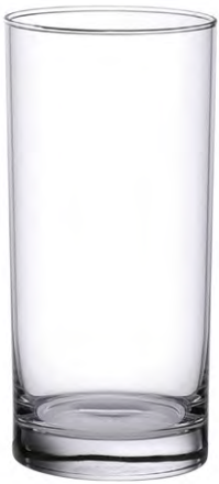
Long drink tumbler / Longdrinkbecher / Gobelet à long drink / Vaso de trago largo / Bicchiere da long drink

La serie economica e performante ideale per servire succhi, soda, acqua e long drink. I prodotti sono pensati per un uso intensivo nella ristorazione collettiva o commerciale.