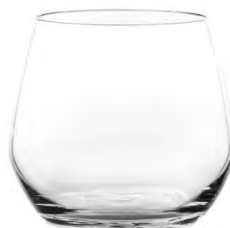
Rocks tumbler / Rocks-Becher / Gobelet rocks / Vaso rocks / Bicchiere rocks