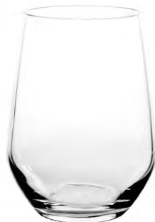
Highball tumbler / Highball Becher / Gobelet Highball / Vaso Highball / Bicchiere Highball