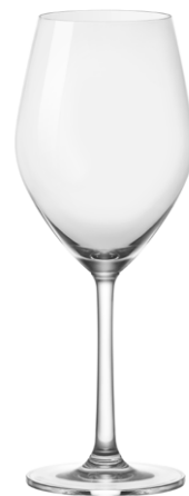
Red wine glass / Rotweinglas / Verre à vin rouge / Copa de vino tinto / Calice di vino rosso