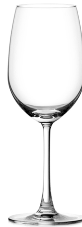
Red wine glass / Rotweinglas / Verre à vin rouge / Copa de vino tinto / Calice di vino rosso