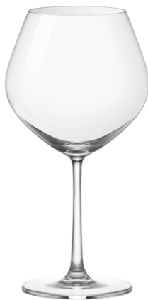
Burgundy glass / Burgunderglas / Verre à Bourgogne / Copa de Bourgogne / Calice da Bourgogne